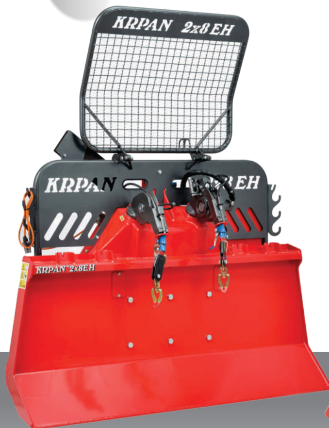
KRPAN 2x8EH, fiksna daska